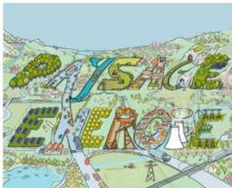
Illustration : Savine Pied

https://acrobat.adobe.com/link/track?uri=urn%3Aaid%3Ascds%3AUS%3A6b987957-b843-3521-9a87-fa351690a5cc