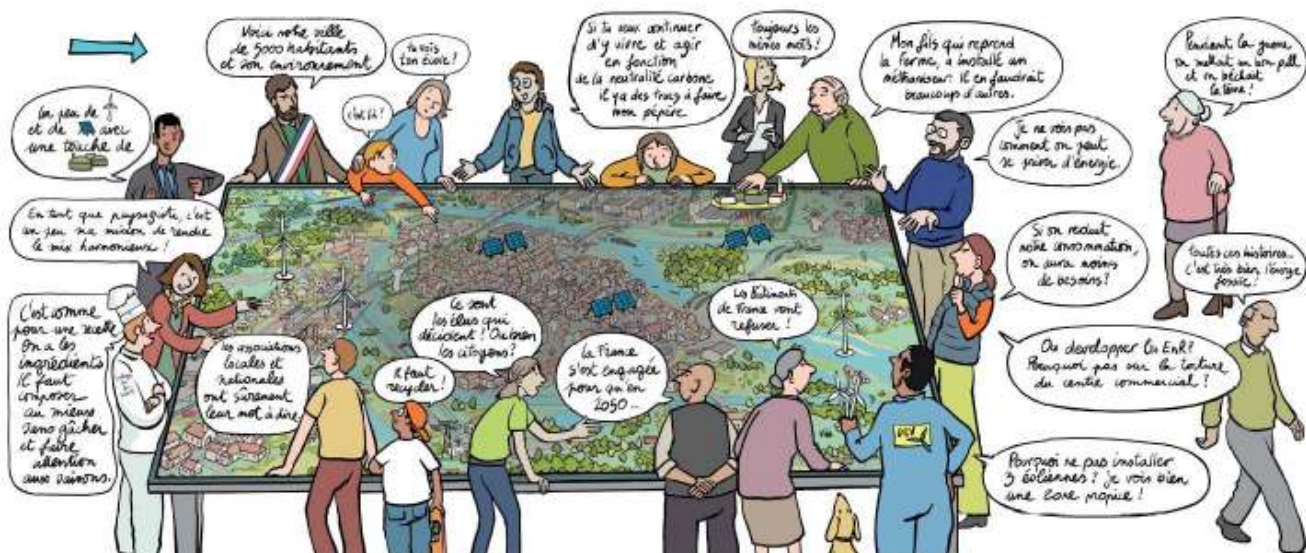
Favoriser la concertation avec l'approche paysagère